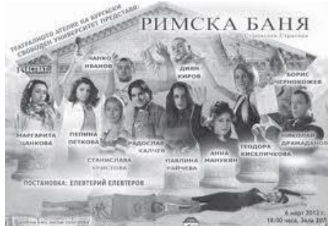
Станислав Стратиев бе изключително популярен драматург

ги - го беше ударил здравата на пиене. За разлика от днес една бутилка чудесна водка „Столичная“ струваше в магазините 1.60 (а не като сега - 16 лева), така че двайсет левовите хонорари, които получаваше (каквито и днес пла-