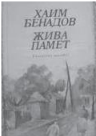
Незабравимата книга на Хайм Бенадов

Така се случи, че в началото на 63 – та можах да се „уредя“ в културния отдел на в. „Кооперативно село“ – орган на Министерството на земеделието. Бях хоноруван стажант – литературен сътрудник: по – ниска позиция нямаше (както и по ниска вестникарска заплата – 55 лева). По-точно цаних се чирак – вестникар главно по две причини – че у